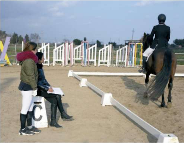
TÉCNICO DEPORTIVO HIPICA

► Bloque específico del TD1, que se cursa entre marzo y junio. Al final del primer curso los alumnos que lo aprueban obtienen el Certificado de Primer Nivel del TDH, documento que permite impartir legalmente clases de equitación según la Ley del Deporte.