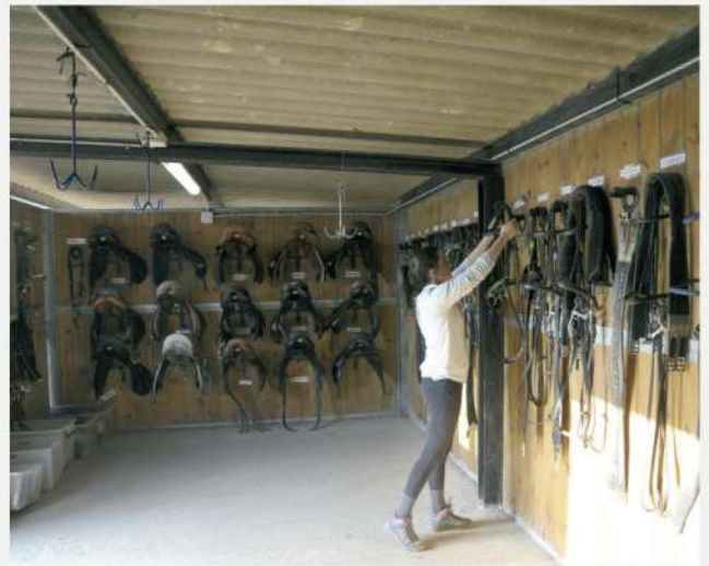
GRADO MEDIO EN ACTIVIDADES ECUESTRES.

► Técnico Deportivo de 2.º nivel en disciplinas olímpicas que se desarrolla de forma compartida entre Les Tanques (Viladecans) y Heras (Cardedeu), que comienza a finales de octubre.