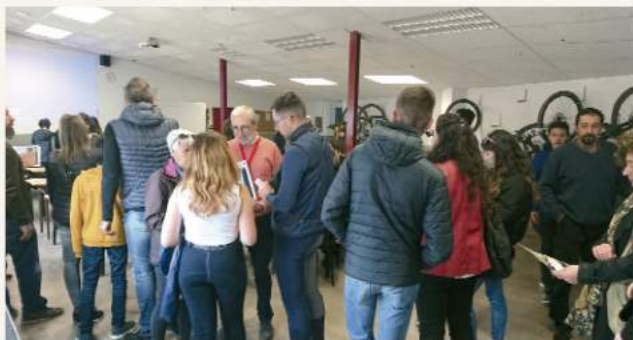
Jornada de Puertas Abiertas.

Estos tres títulos nos permiten múltiples opciones de diseño de una carrera profesional ecuestre dentro del sistema educativo reglado. Este diseño dependerá de los intereses del alumno y en gran medida también de su edad.