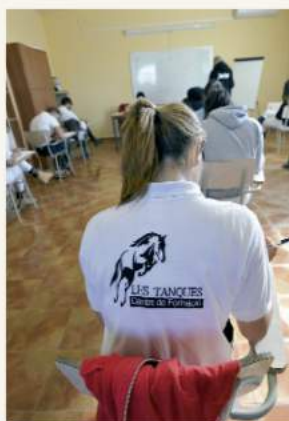
Final de curso, exámenes teóricos en Les Tanques.