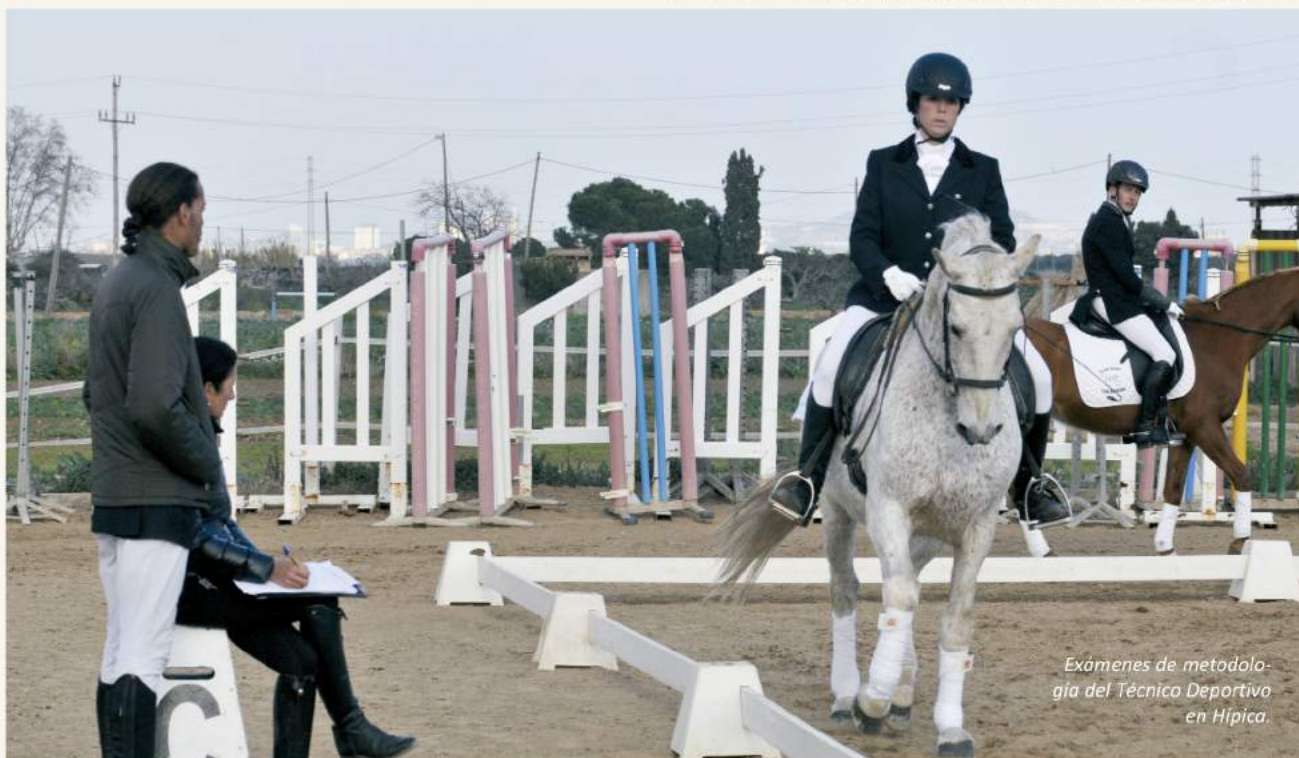
Exámenes de metodología del Técnico Deportivo en Hípica

Hemos vivido momentos de nervios, lloros por resultados peores de los esperados y mucha alegría y distensión cuando el trabajo de todo el año da como resultado un buen examen final. En general estamos muy satisfechos por los resultados obtenidos