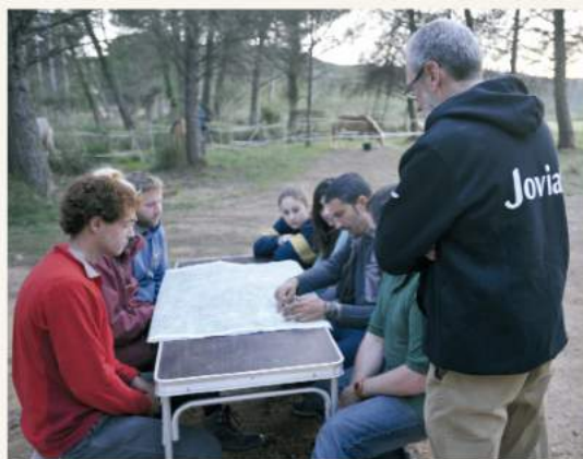
Planificación del recorrido en una ruta con pernoctación del ciclo final del Técnico Deportivo en Hípica.

▶ Perfil ganadero/veterinario: Para los alumnos que tienen una vocación más enfocada a la vertiente agro ganadera la mejor opción sería cursar el TAE y posteriormente obtener el título de TSG. Este itinerario es un poco más largo, ya que representa una duración de cuatro cursos académicos.