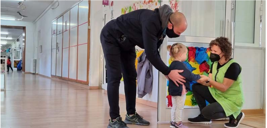
Entrada a l'escola