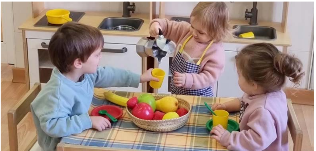
Racon: Joc Simbòlic

Amb el dibuix d'una família envoltant un cor, ens parla del desenvolupament de l'organització cap a una consciència social i mediambiental i de la comprensió sistemàtica de l'escola i del món.