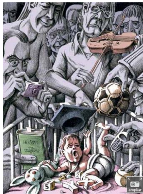
Papá dame un respiro- SANTIAGO VALENZUELA

Lo que descubrí es que los adultos han secuestrado la infancia de los niños de una manera nunca vista hasta ahora. Bajo presión explora el porqué del fracaso del modelo infantil actual y ofrece propuestas de todos los rincones del mundo para ayudarnos a encontrar una solución. El libro no es un manual para padres. Mi intención va más lejos: redefinir lo que significa ser niño y padre en el siglo XXI.